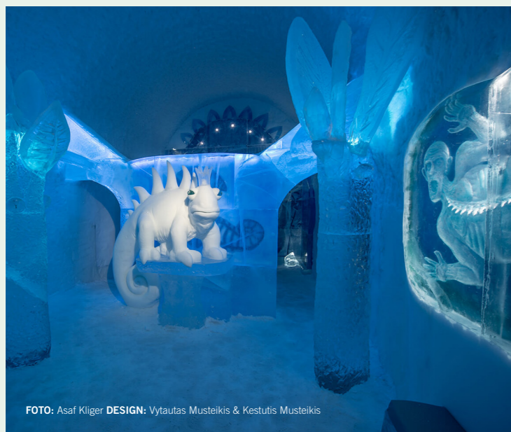
DESIGN: Vytautas Musteikis &amp; Kestutis Musteikis

– Förvänta dig att ingredienserna och elementen ska vara runt dig... Svampen du passerar, bäret du plockar eller fisken du fångar. Vi kommer att ha fisk, vilt och bär. De presenteras torkade, färska, rökta eller syltade beroende på när du kommer. Det kommer att vara hållbart, unikt, gott, säsongsbetonat och lokalt. ●